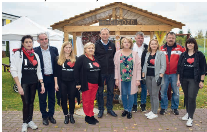
Powstałe w sierpniu Koło Gospodyń Wiejskich w Micigoździe ma bardzo dużo planów.