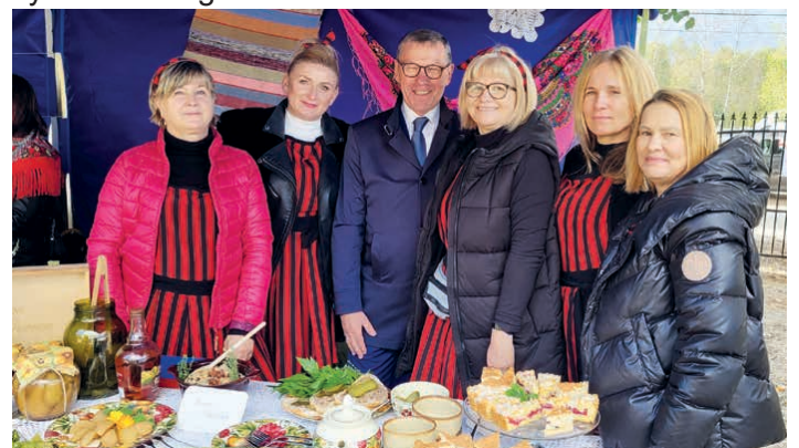
Aktywna Brynica zajęła III miejsce na festiwalu.