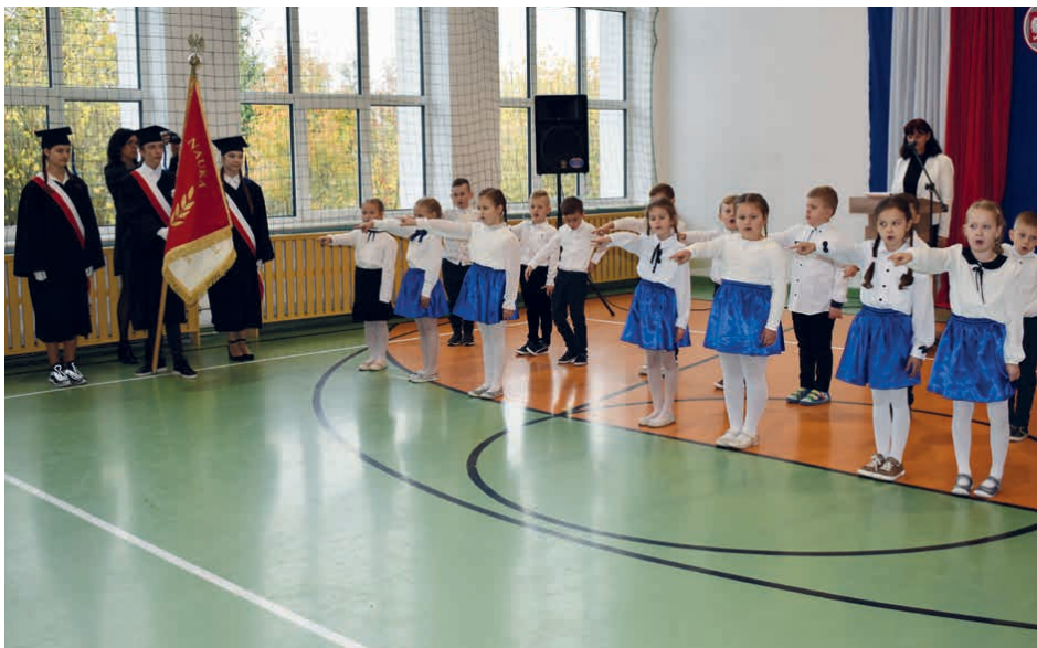
Pierwszaki z Zajączkowa również złożyły ślubowanie.

Trzeba przyznać, że dla wszystkich pierwszaków ślubowanie i pasowanie na ucznia to wyjątkowo podniosła chwila. – Ślubuję być dobrym uczniem, dbać o dobre imię szkoły, uczyć się pilnie i być dobrym kolegą. Swym zachowaniem i nauką będę sprawiać radość rodzicom i nauczycielom – ślubowali uczniowie, a następnie dostąpili zaszczytu pasowania na ucznia. Od tej chwili stali się prawdziwymi uczniami ze wszystkim przywilejami i obowiązkami uczniowskimi. I tak, w szkole w Piekoszowie przysięgę złożyło 67 uczniów, w szkole w Szczukowskich Górkach