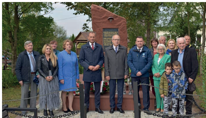
Hołd poległym złożyli przedstawiciele władz samorządowych, powiatowych oraz mieszkańcy.