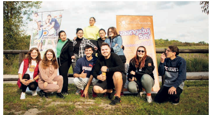
Gośćmi byli wolontariusze Europejskiego Korpusu Solidarności.