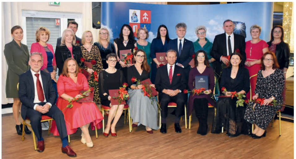
Wójt gminy Piekoszków wręczył nagrody dwunastu nauczycielom.