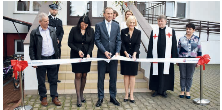
Uroczyste otwarcie szkoły w Zajączkowie po termomodernizacji.