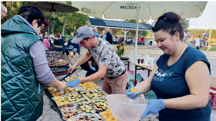
Zgromadzeni mieszkańcy przygotowali smakowite poczęstunki.