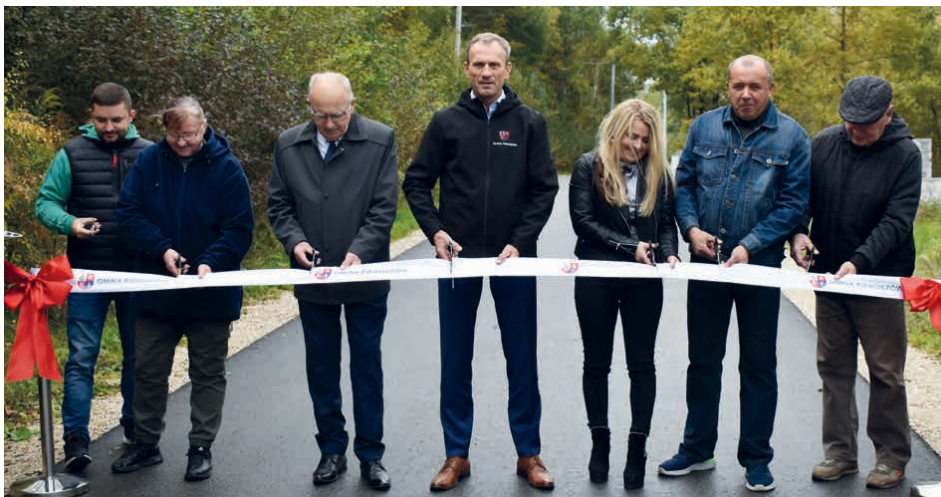
Również droga gminna w Gałęzicach zyskała nową nawierzchnię i pobocza.