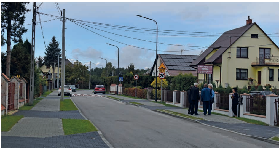
Ulica Witosa w Piekoszowie przeszła całkowitą metamorfozę.

Zdzisław Grosicki Wiceprzewodniczący Rady Gminy Piekoszów