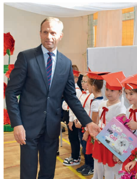
Wójt gminy Piekoszów wręczał pierwszoklasistom prezenty i składał gratulacje.