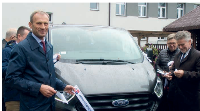
Uczestnicy ŚDS wreszcie mają własny środek transportu.