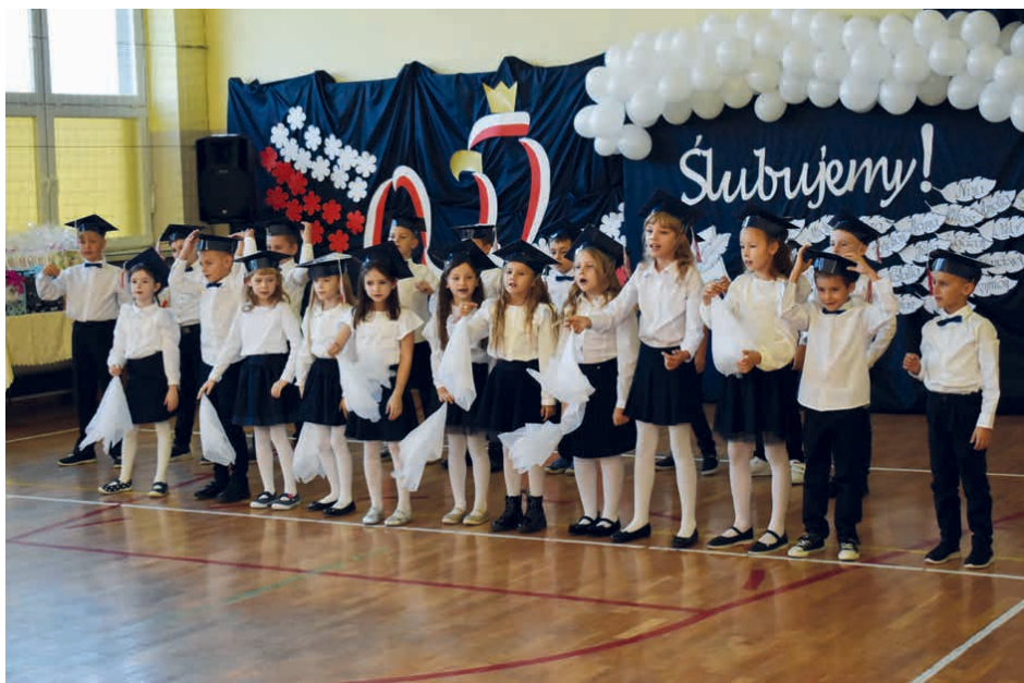
Pierwszoklasiści ze szkoły w Brynicy pokazali swoje talenty.