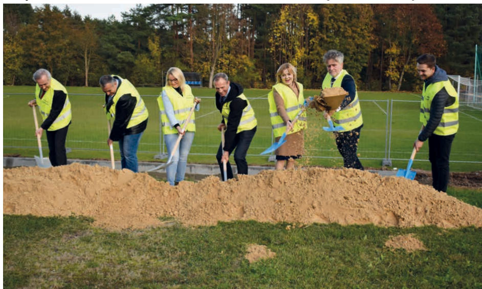
Prace przy boisku wielofunkcyjnym już się rozpoczęły.