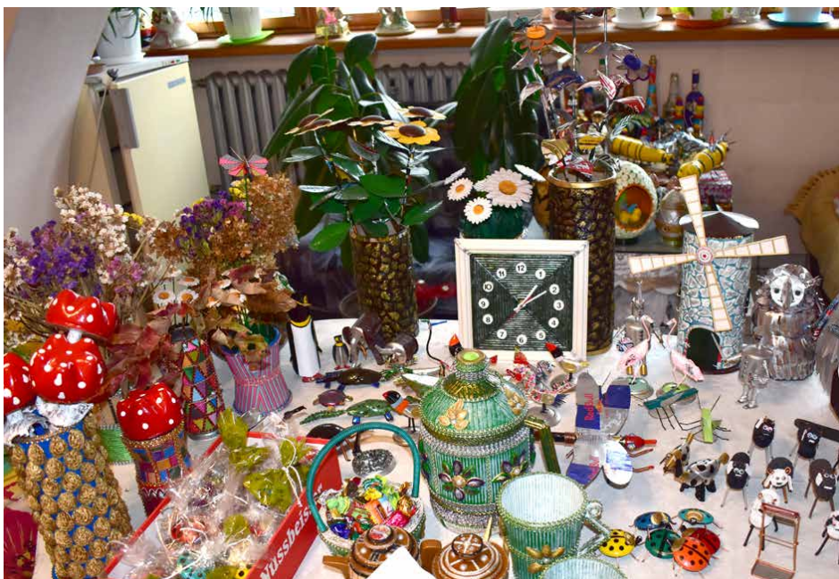
Wśród stworzonych przedmiotów odnajdziemy m.in. kwiaty, filiżanki, szkatułki, zwierzęta, wiatrak, zegar, ozdobne butelki czy kompozycje.

Jak widać, artystą i człowiekiem o niezwykłej pasji i talencie może zostać każdy. Wystarczy tylko tę pasję i talent w sobie odkryć i je szlifować. /kcz/