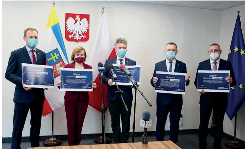
Na budowę Centrum Kultury i Bezpieczeństwa w Zajączkowie pozyskano 2,5 mln złotych.

– Strażacy z Zajączkowa niejednokrotnie służą pomocą mieszkańcom gminy Piekoszów i sąsiednich gmin, w przypadku pożarów, podtopień, wypadków samochodowych i innych zdarzeń. Stworzenie odpowiednich warunków członkom OSP z Zajączkowa, będzie przekładało się na zwiększenie poczucia bezpieczeństwa wśród mieszkańców gminy – podkreśla Zbigniew Piątek