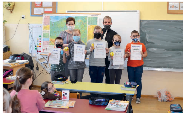
O języku polskim, frazeologii i młodzieżowym języku mówiono w szkole w Brynicy.

Celem podejmowanych działań było przyjrzenie się polszczyźnie okiem młodzieży oraz kształtowanie świadomości językowej i propagowanie kultury języka ojczystego. Starsi uczniowie z klas IV-VIII mogli wykazać się znajomością języka młodzieżowego i przygotować filmik, gdzie zostanie przekazany młodzieżowy kod językowy. Język młodomowy, czyli język nastolatków, jest bardzo bogaty i niezwykle charakterystyczny. Powodem jest to, że osoby młode spędzają dużo czasu w Internecie i mediach społecznościowych. Naszym celem było zaproszenie młodzieży, nie tylko