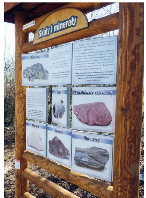
Jeden z elementów ścieżki dydaktycznej w Jaworzni.