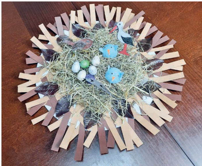
Dzieci wykonywały ptasie gniazda.