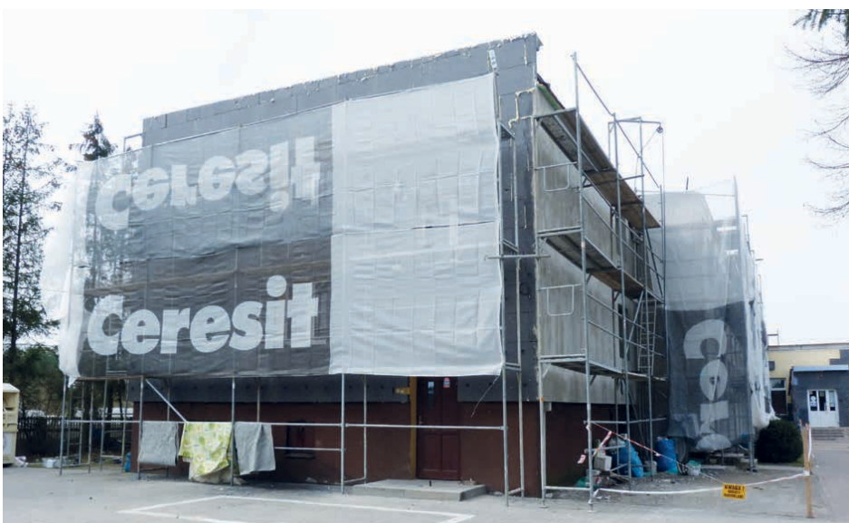
Jednym z budynków, które przejdą termomodernizację jest szkoła w Micigoździe.