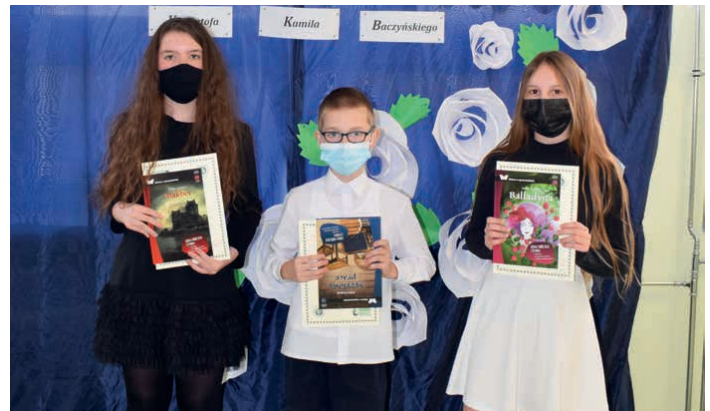
Laureaci konkursu recytatorskiego.