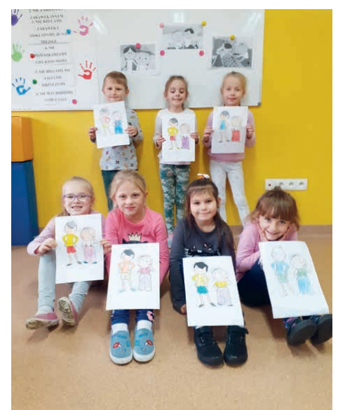
Podczas Tygodnia Kultury Języka, dzieci wykonywały również prace plastyczne.