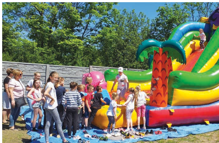
Dmuchańce cieszyły się dużą popularnością. (fot. SP Szczukowskie Górkki)