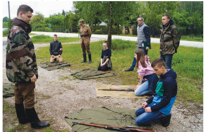
Uczestnicy gry rozkładali i składali broń oraz oddawali strzały.