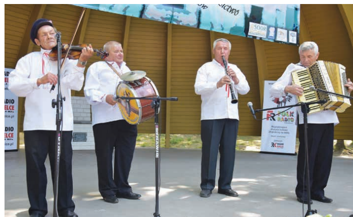
Kapela z Rykoszyna.