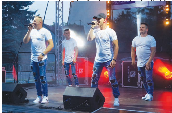
Sobotnia gwiazda wieczoru - zespół Maxel.

Taneczna sobota – taki tytuł nosił drugi dzień MegaMocy Piekoszowa, 15 czerwca, a wszystko to za sprawą mnóstwa tanecznej muzyki jaką zapewniły występujące