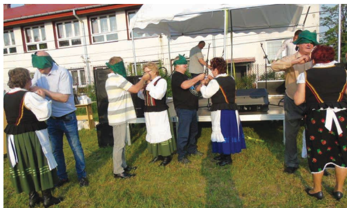
W zabawach brały udział nie tylko dzieci, ale i dorośli.