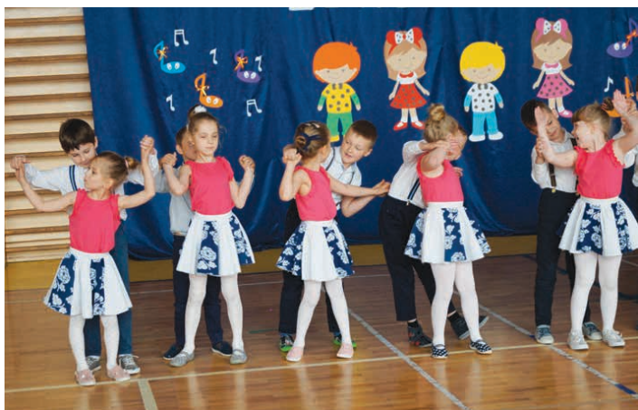
Przedszkolaki prezentowały wysoki poziom taneczny.

W barwnych strojach i z ogromnym zaangażowaniem wszyscy przedstawili się ze znakomitej strony w związku z czym wszyscy okrzyknęci zostali zwycięzcami. /kcz/