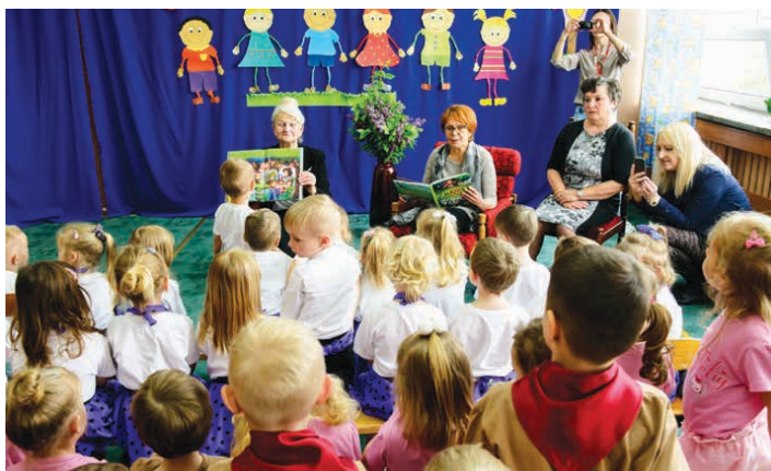
Seniorzy czytali najmłodszym w przedszkolu w Piekoszowie.

W dialogu pokoleń wzięło udział osiem grup przedszkolnych z ZPO w Piekoszowie oraz Klub Seniora. Dzieciom czytano klasyczne pozycje ze świata baśni m.in. „Czerwonego Kapturka” czy „Śpiącą Królewnę”.