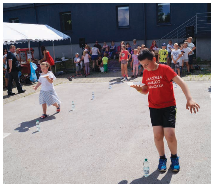
Dzieciaki brały udział m.in. w wyścigach.

Na amatorów nauki lub rywalizacji czekały konkursy zorganizowane przez Language Academy z Piekoszowa, które dodatkowo szlifowały język angielski uczestników.