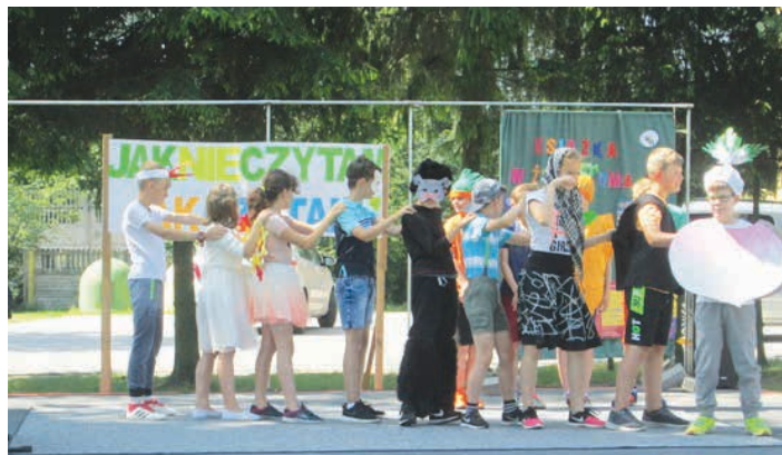
Inscenizacja w wykonaniu czwartoklasistów.

Wspólna wesoła zabawa niewątpliwie przyczyniła się do pogłębienia integracji. /ZOPI w Micigózdzie/