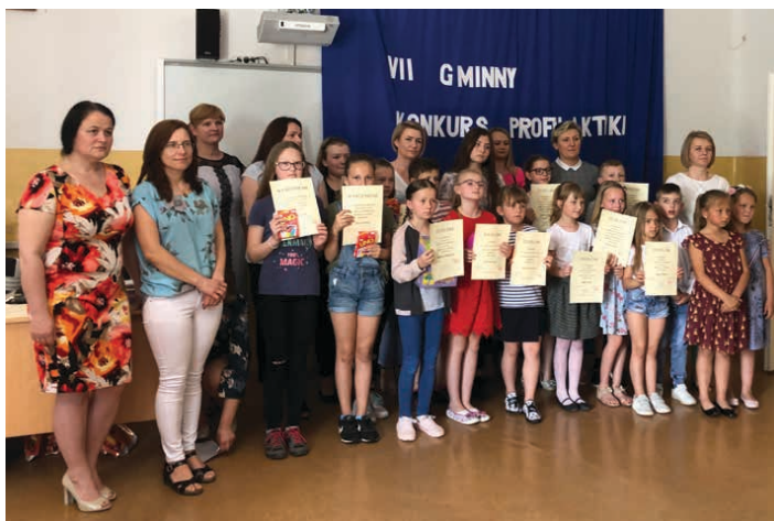
Laureaci konkursu profilaktycznego

Zadaniem uczestników konkursu było wykonanie prac o tematyce profilaktycznej. Uczniowie klas I-III stworzyli plakaty promujące zdrowie. Uczniowie kl. IV – VI napisali wiersze, rymowanki, natomiast uczniowie kl. VII, VIII i gimnazjum wykonali prezentacje multimedialne promujące alternatywne sposoby spędzania wolnego czasu.