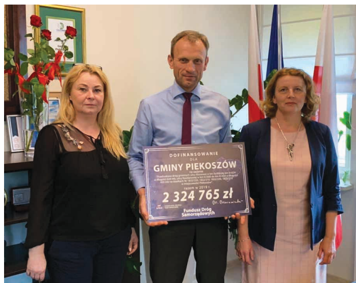
Dofinansowanie pochodzi z Funduszu Dróg Samorządowych.