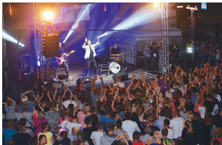
Podczas koncertu Power Play publiczność świetnie się bawiła.