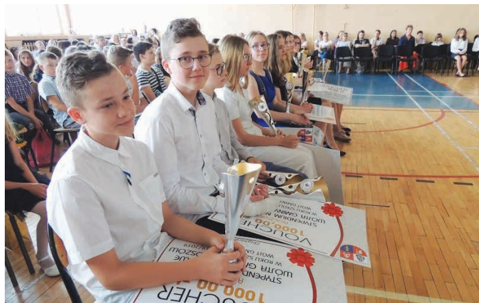
Tegoroczni stypendiści z Piekoszowa.