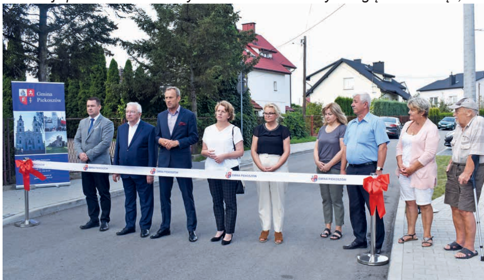
Ulica Reja w Piekoszowie przeszła kompleksowy remont.

Małgorzata Pietrzykowska Radna Gminy Piekoszów