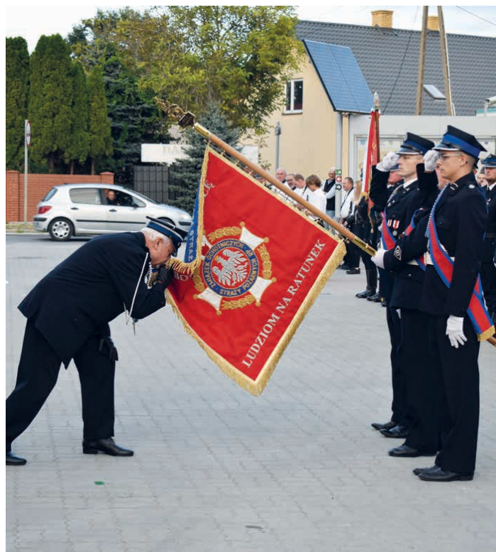
Jednostka strażacka z Piekoszowa została odznaczona Złotym Znakiem Związku.