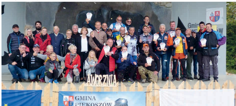
Po raz pierwszy odbył się Puchar Świata motocykli klasycznych. Na zdjęciu zwycięzcy i uczestnicy tych rywalizacji.