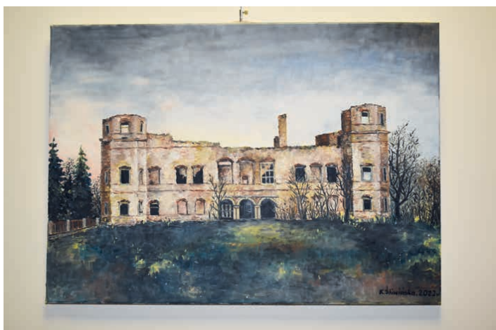
Obraz autorstwa Kazimierzy Śliwińskiej.