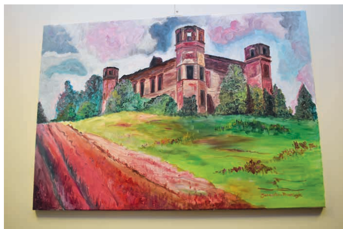
Obraz autorstwa Joanny Janowskiej-Pisarczyk.