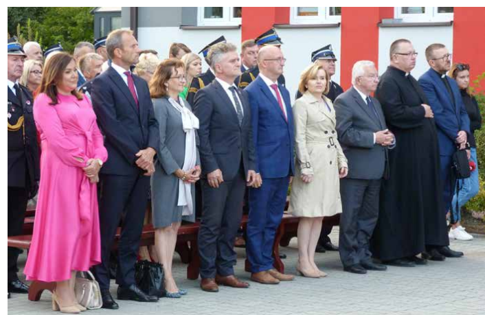
Obecni goście złożyli gratulacje za dotychczasową działalność OSP Piekoszów oraz życzenia na dalsze lata służby.

Warto zaznaczyć, że OSP Piekoszów należy do grona 236 jednostek znajdujących się w Krajowym Systemie Ratowniczo-Gaśniczym. – Jednostka z Piekoszowa jest w pierwszej dziesiątce pod względem działań, aktywności, wyposażenia. To pokazuje jak pręźnie działają, bezinteresownie niosąc pomoc drugiemu człowiekowi. Za to im serdecznie dziękuję