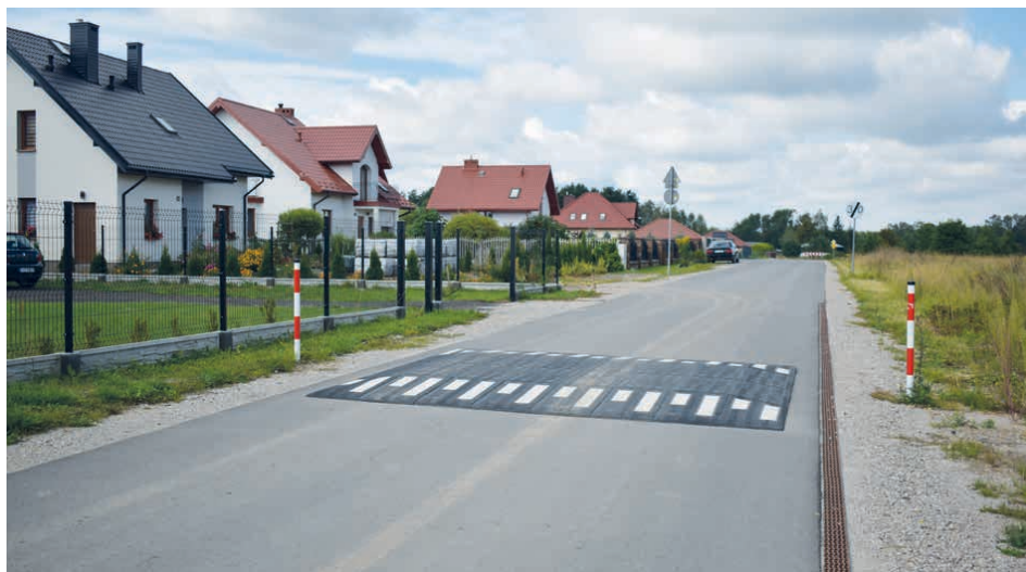
Przebudowane zostały także ulice Leśna i Południowa w Micigoździe.