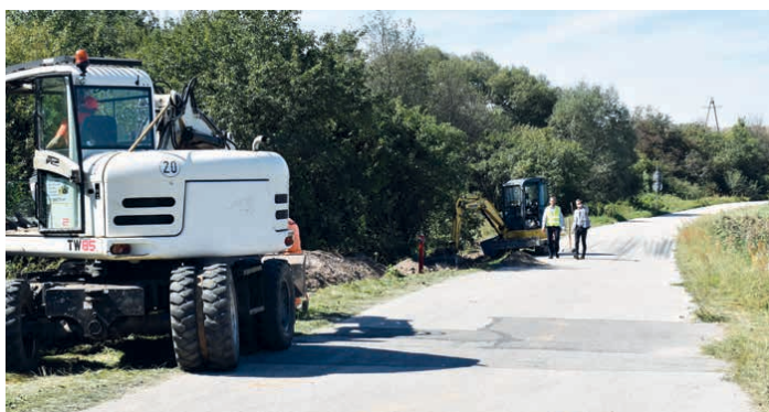
Prace przy budowie nowego wodociągu i wymianie przyłączy zakończą się do marca 2023 roku.