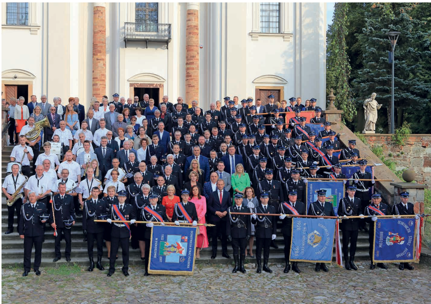
W uroczystościach obchodów stulecia OSP Piekoszków wzięli udział parlamentarzyści, przedstawiciele władz wojewódzkich, powiatowych, gminnych, poczty sztandarowe jednostek OSP, Orkiestra Dęta z Piekoszowa oraz pozostali zaproszeni goście i mieszkańcy. (fot. Stanisław Rysiński)