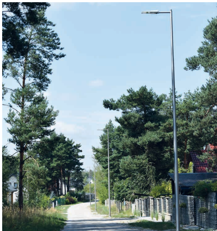
Ulica Lawendowa zyskała nowoczesne oświetlenie.