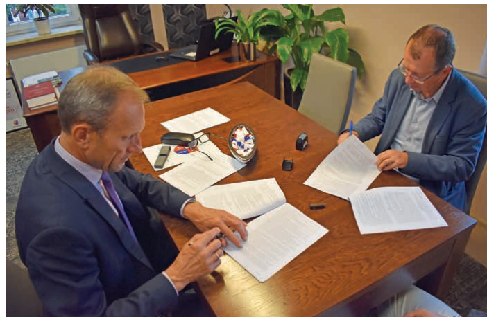
W ostatnim czasie podpisano umowę m.in. na remont drogi w Łubnie.

Łącznie, remont przejdzie blisko kilometrowy odcinek drogi. Jezdnia zostanie poszerzona do szerokości 5 metrów, wzmocniona zostanie jej konstrukcja,