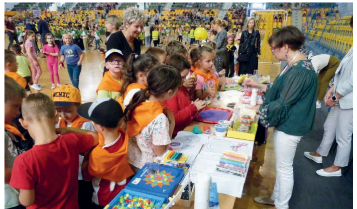
Pierwszaki z gminy Piekoszów także uczestniczyły w zabawach.