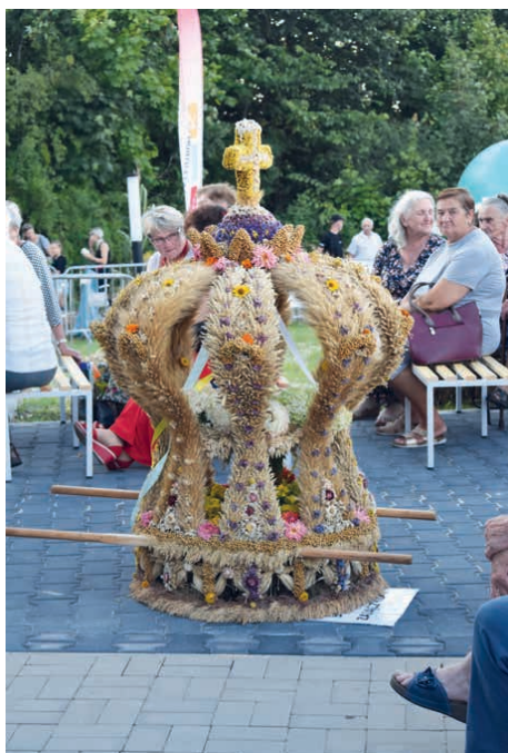
Najpiękniejszym Wieńcem został okrzyknięty ten wykonany przez sołectwo Zajączków.

w wykonaniu Piekoszowian, przyszedł czas na występy zespołów. Na scenie pojawili się Wincentowianie, Piekoszowianie, Wierna Rzeka, Zespół Śpiewaczy z Rykoszyna, Kapela z Rykoszyna oraz zespół „Z Taborem” z Klubu Senior+. – Występy tych grup znakomicie wpisują się w tradycję dożynek. Bardzo ważne jest, aby kultywować ten zwyczaj, przekazywać go z pokolenia na pokolenie. Poprzez organizację takich imprez wyrażamy wdzięczność rolnikom, za ich pracę i poświęcenie, życząc zawsze dobrych zbiorów oraz