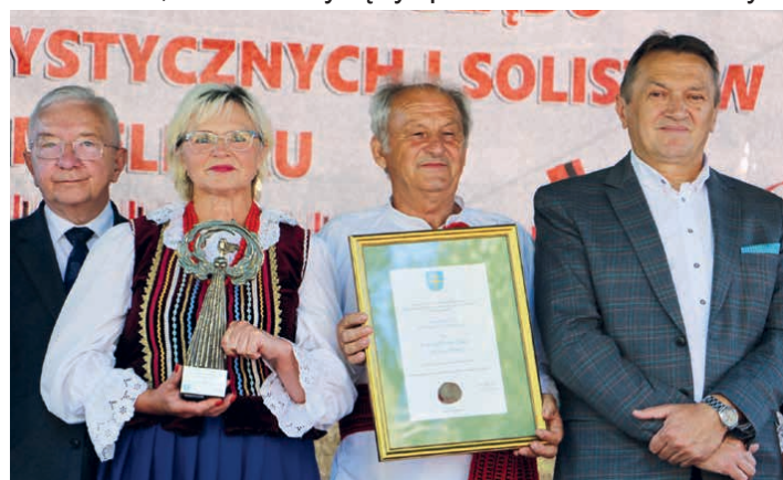
Zespół „Wierna Rzeka” z doroczną nagrodą starosty kieleckiego.

Powody do radości mieli także Wincentowianie, którzy zajęli trzecie miejsce na podium podczas XXII Powiatowego Przeglądu Zespołów Folklorystycznych i Solistów w Chmielniku, a także zwyciężyli podczas Festiwalu Muzyki