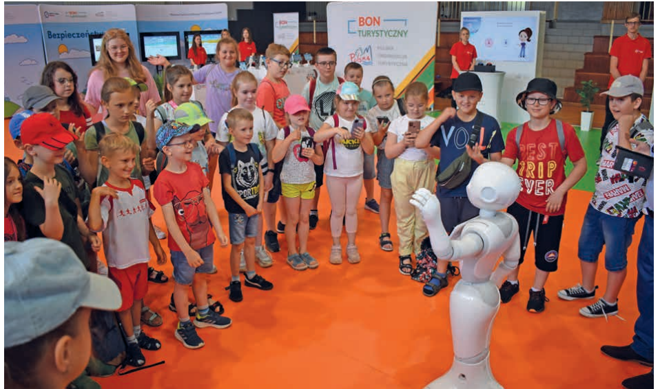
Uczniowie poznali m.in. inteligentnego robota.

kinowym 5D, a także uczestniczyły w quizach czy tradycyjnych grach planszowych. /kcz/