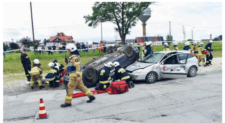
Podczas manewrów, strażacy udzielali pomocy rannym, gasili pożar samochodu i ewakuowali poszkodowanych.

Manewry zostały zorganizowane przez Komendanta Gminnego ZOSP RP oraz wójta gminy Piekoszków. Na prośbę komendanta gminnego do pomocy w działaniu podczas manewrów dołączyli: Komenda Miejska PSP z Kielc, Wydział Ruchu Drogowego z Komendy Wojewódzkiej Policji, Wydział Ruchu Drogowego z Komendy Miejskiej Policji oraz Świętokrzyskie Centrum Ratownictwa Medycznego. /kcz/