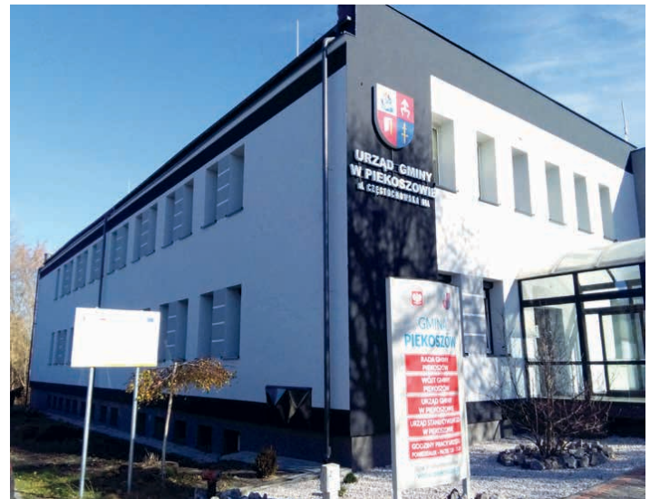
Piekoszów uzyska prawa miejskie.