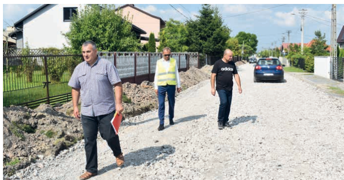
Droga w Łaziskach właśnie przechodzi generalny remont.