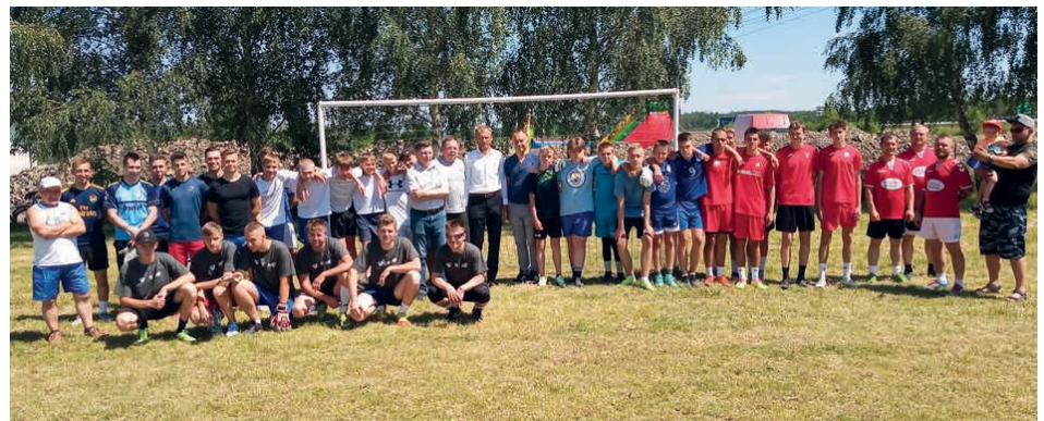
Piłkarskie turnieje w Janowie cieszą się coraz większą popularnością.

Zwycięski puchar w drużynach juniorów zdobyła drużyna Janów Dolny, a drugie miejsce drużyna Naprzód Janów. W drugiej grupie zawodników zwyciężyła drużyna FC Janów Dolny, drugie miejsce zajęły Janowskie Bajery, trzecie FC Janów Górny i czwarte drużyna Zakolaki.