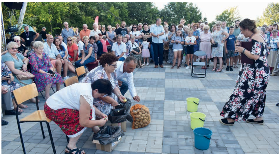
Wzorem lat ubiegłych w tym roku również odbył się Turniej Sołtysów.