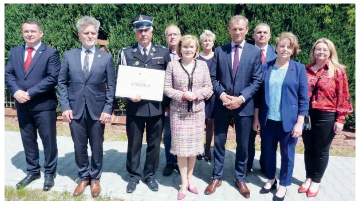
Ochotnicza Straż Pożarna w Piekoszowie zyskała ponad 8 tysięcy złotych na zakup sprzętu i umundurowania.

przed Wojewódzkim Funduszem Ochrony Środowiska i Gospodarki Wodnej w Kielcach, a uczestniczyła w nim wiceminister Anna Krupka. – Środki przekazywane dla jednostek Ochotniczych Straży Pożarnych są docenieniem ich ciężkiej służby – podkreśla wiceminister. – Druhowie ochotnicy są gotowi na każde wezwanie stanąć i ratować innych. Są niezwykle potrzebni. Dzięki takim programom, wsparciu rządu i samorządów pokazujemy, że bardzo zależy nam na strażakach – dodał z kolei senator Krzysztof Stoń. /A. Olech/