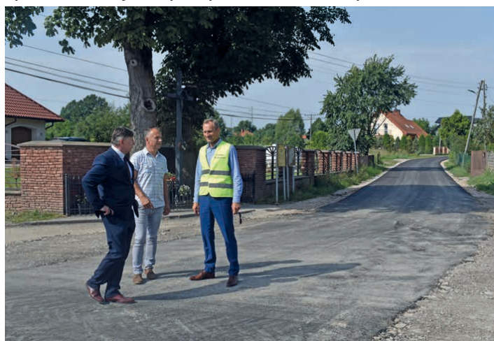
W Janowie powstaje kanalizacja i nowe drogi.