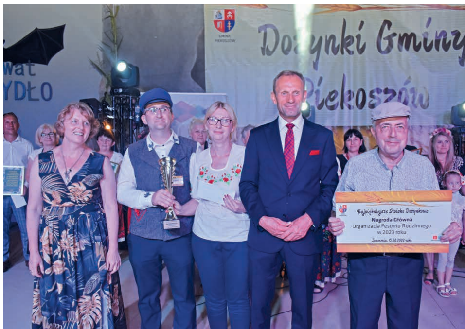
Z kolei Najpiękniejszym Stoiskiem Dożynkowym wybrano to przygotowane przez sołectwo Jaworznia. Nagrodą w tym konkursie jest organizacja festynu rodzinnego w 2023 roku.