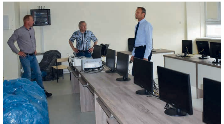
Nowoczesne pracownie powstaną w piekoszowskiej szkole.