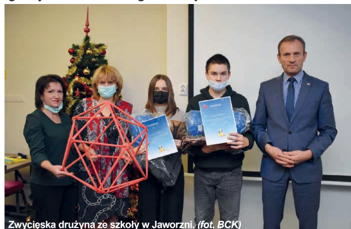
Zwycięska drużyna ze szkoły w Jaworzni.