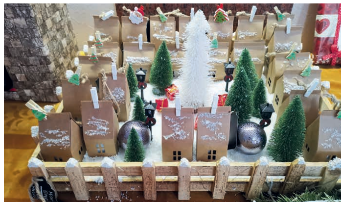
Jeden z nagrodzonych kalendarzy adwentowych.