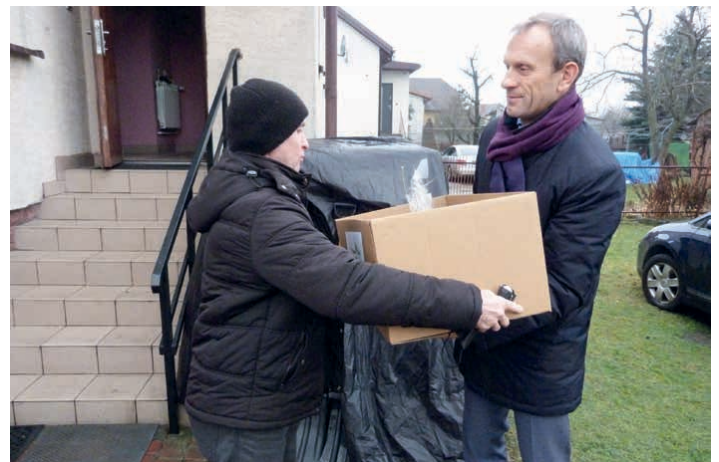
Paczki świąteczne trafiły do 80 potrzebujących mieszkańców.