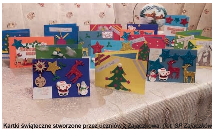
Kartki świąteczne stworzone przez uczniów z Zajączkowa.

Do tej pięknej świątecznej akcji włączyły się również inne placówki oświatowe nie tylko z gminy Piekoszów oraz Klub Seniora i Gminny Ośrodek Pomocy Społecznej w Piekoszowie. /kcz/