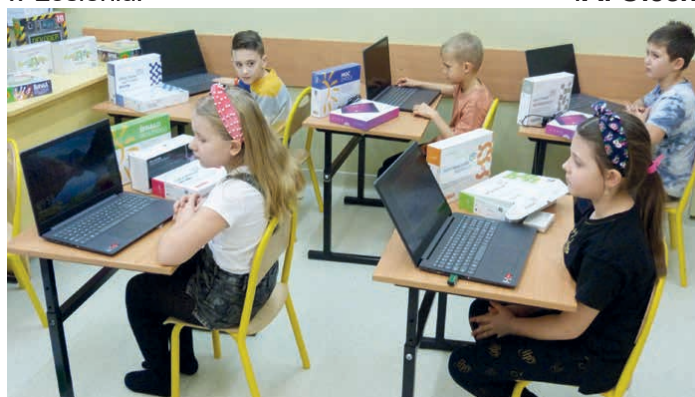
Do szkoły w Łosieniu trafiły laptopy, tablety i gry edukacyjne.