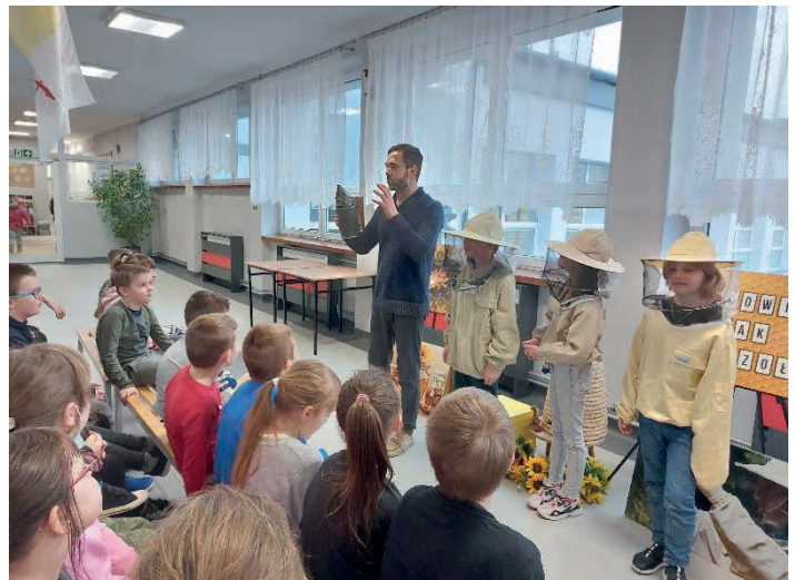
Spotkanie z pszczelarzem było bardzo interesujące.