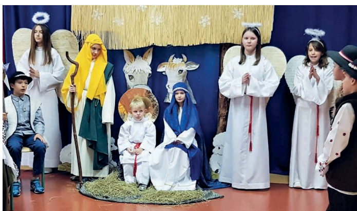
Jasełka skłoniły do refleksji i zastanowienia.