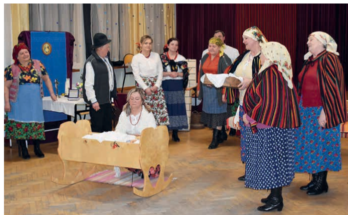
Piekoszowianie zajęli drugie miejsce w przeglądzie.