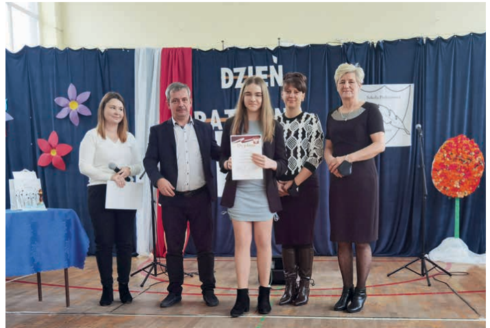
Święto patrona szkoły oraz rozstrzygnięcie konkursu.