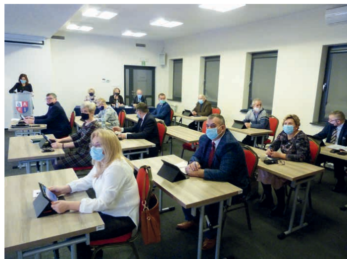
Budżet na 2022 rok został uchwalony podczas grudniowej sesji.